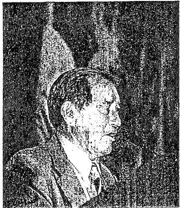
Vélez presentó a la Alcaldesa como el "hada madrina" de los maestros boricuas.

Johnson rehusó entrar en los méritos de la querrela de Medina y López.