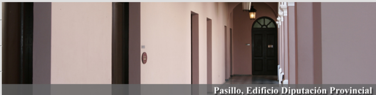
Pasillo, Edificio Diputación Provincial